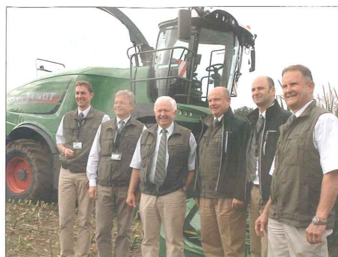
Optimistisch: Die Agco-Geschäftsführung gemeinsam mit den Entwicklern vor ihrem jüngsten „Baby“, dem Feldhäcksler Kata-na 65.

le es offensichtlich immer noch schwer, vernünftige Finanzierungen für westliche Landtechnik zu bekommen.